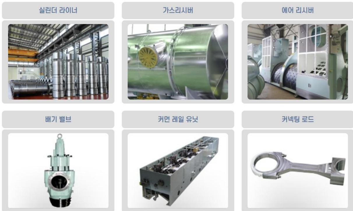
Figure 3. 연결 자회사 삼성중공업 선박엔진 부품