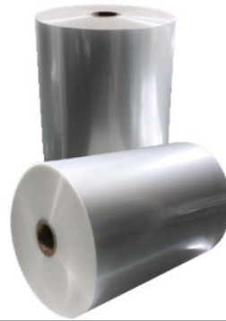
Figure 2. 적자 지속 CPP Film 라인 가동중단