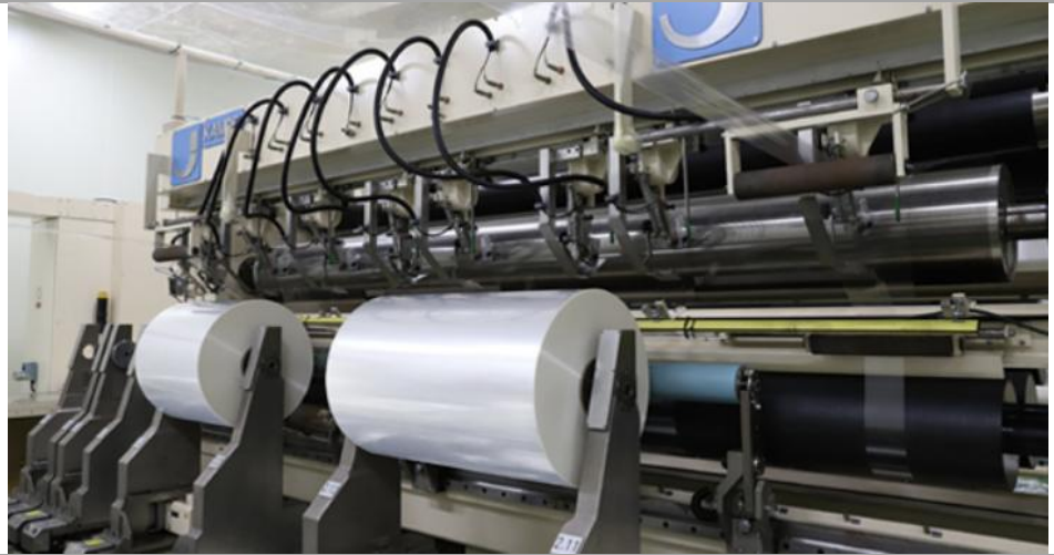
Figure 1. 국내 유일 Capacitor Film 제조 기업